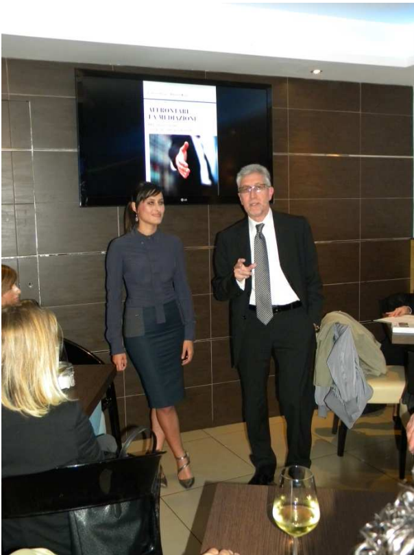
Della realizzazione dell'evento è stato fornito grande risalto nei quotidiani locali.